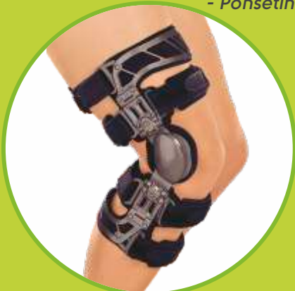
Ortézy na varózne a valgózne koleno