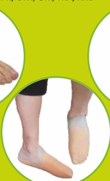
Protézy nohy silikónové privykacie