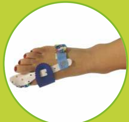
Ortézy na hallux valgus