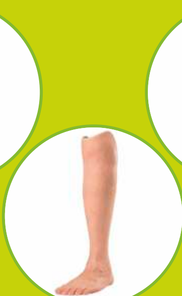
Protézy predkolenné silikónové definitívne