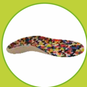
Ortopedické vložky korýtkové