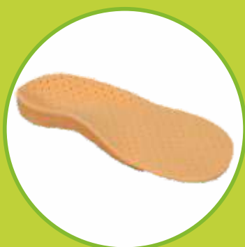
Ortopedické vložky korýtkové