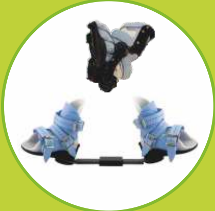
Detské abdukčné dynamické ortézy - Denis Brown - Ponsetiho aparát

Predpisujúci lekár: OPR, ORT, CHI, TRA, RHB