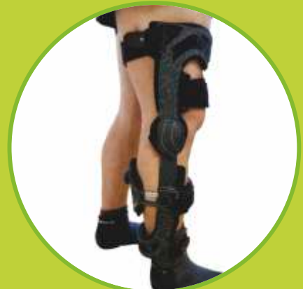
Ortézy kolenného kĺbu, štvorbodové, pri zranení zadného krížneho väzu