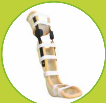
Ortézy s limitovaným rozsahom fixačné